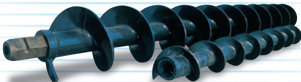
オーガースクリュー