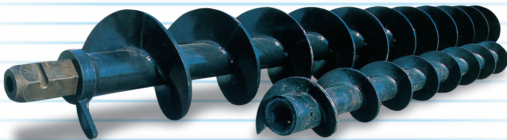
オーガースクリュー